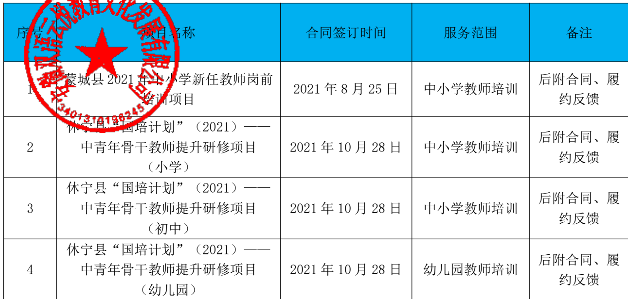
相关培训业绩一览表